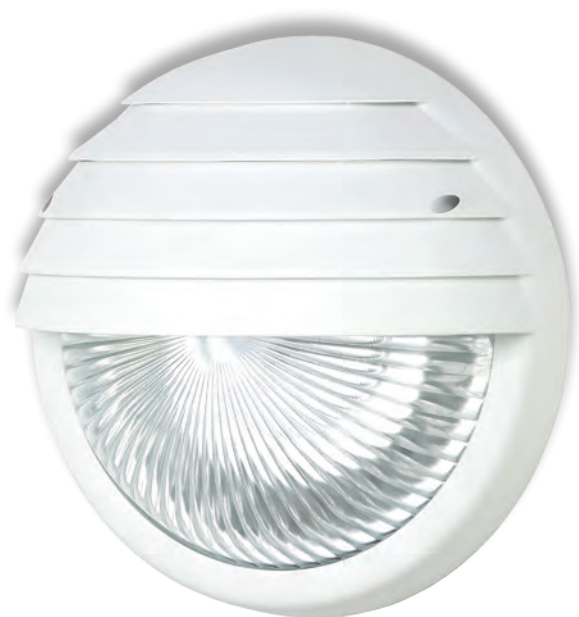
OPTIMA 1 2x9W