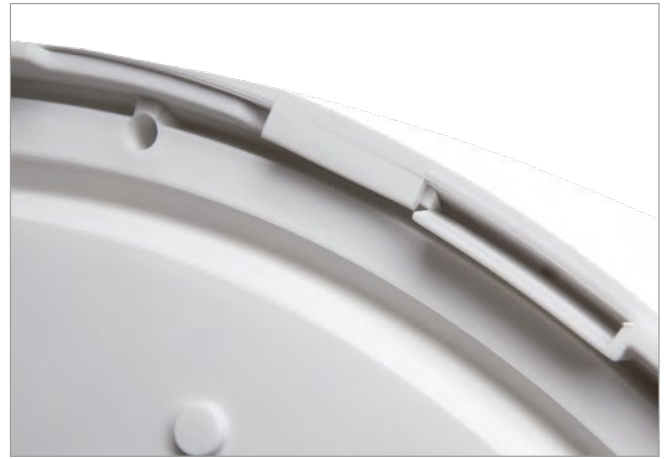
Detale | Details