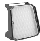
Magnum MultiBattery XS