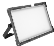
Magnum MultiBattery L