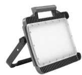
Magnum MultiBattery M